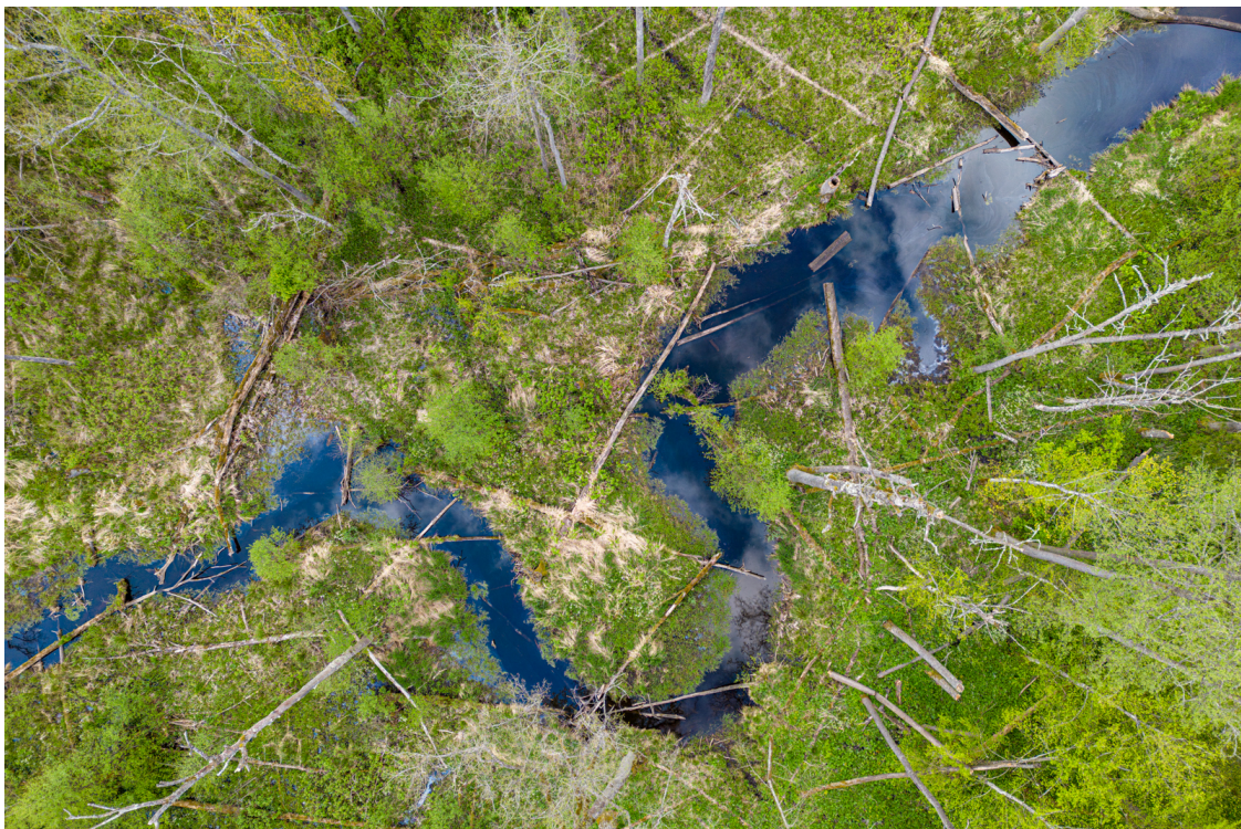
Méandre d'un cours d'eau dans la forêt de Białowieża, Pologne