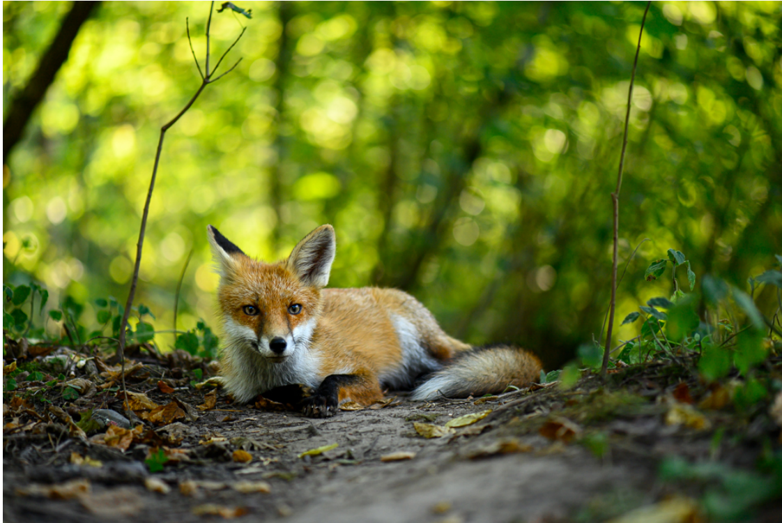
Renardeau ( Vulpes vulpes ), Białowieża, Pologne

Notre année écoulée nous a permis de prendre un essor vers des actions de plus en plus concrètes sur les territoires, de rencontrer des acteurs clefs, de créer des partenariats, de mobiliser et d'impliquer de nouvelles personnes au sein de notre projet associatif . Nous activons un réseau aussi étendu que compétent pour aborder les grandes questions que notre projet pose : quelle place faire à une très grande forêt préservée à l'heure actuelle ? Comment reserrer nos liens avec elle, en tant que société, sans la détruire ? Quel héritage vivant laisser aux générations qui nous suivent ?