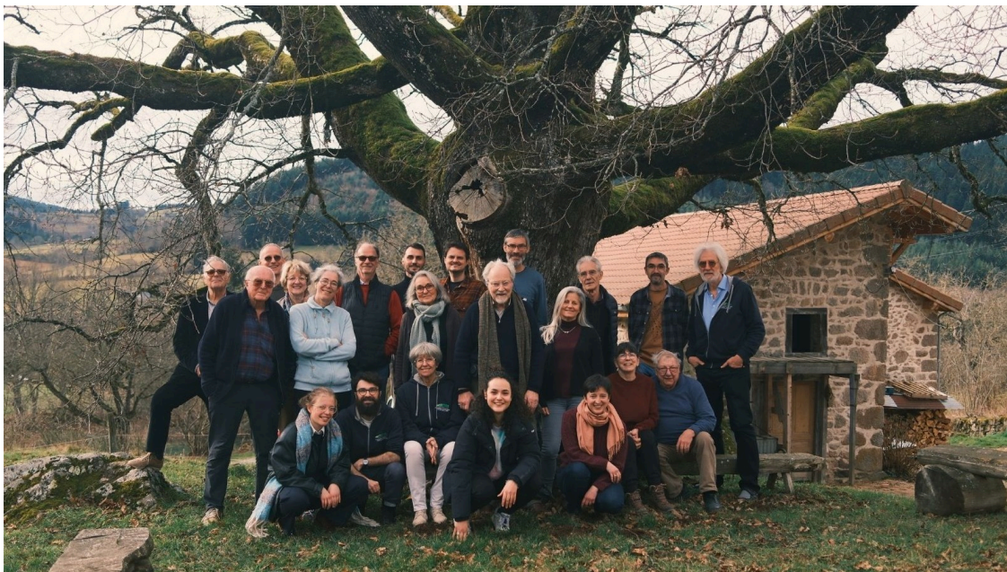
Les membres du conseil d'administration et de l'équipe opérationnelle réunis... presque au complet !

Une association à but non lucratif fonctionne de manière collégiale afin d'en garantir la gestion désintéressée : plusieurs organes s'imbriquent, souvent de manière propre à chaque association ; dans notre cas, un conseil d'administration responsable de la stratégie d'ensemble, un bureau responsable de la bonne tenue des activités, des questions légales, administratives et financières, et une équipe opérationnelle, composée à la fois de personnes salariées et de bénévoles, chargée de l'animation quotidienne du projet.