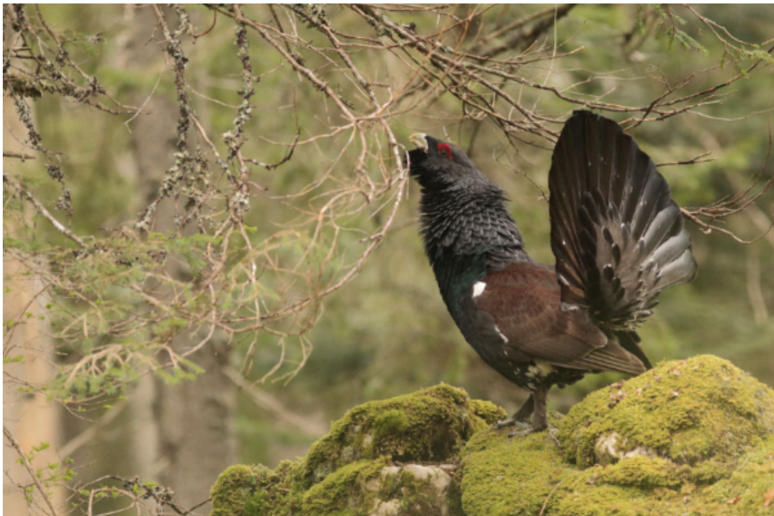
Grand Tétras

Les effectifs de l'animal s'effondrent dans les montagnes françaises. Surfréquentation des massifs et réchauffement climatique vont finir par avoir ses plumes. Que faire ? Les processus de réintroduction se heurtent à la brutalité du réel : les conditions sont de moins en moins réunies pour sa subsistance.